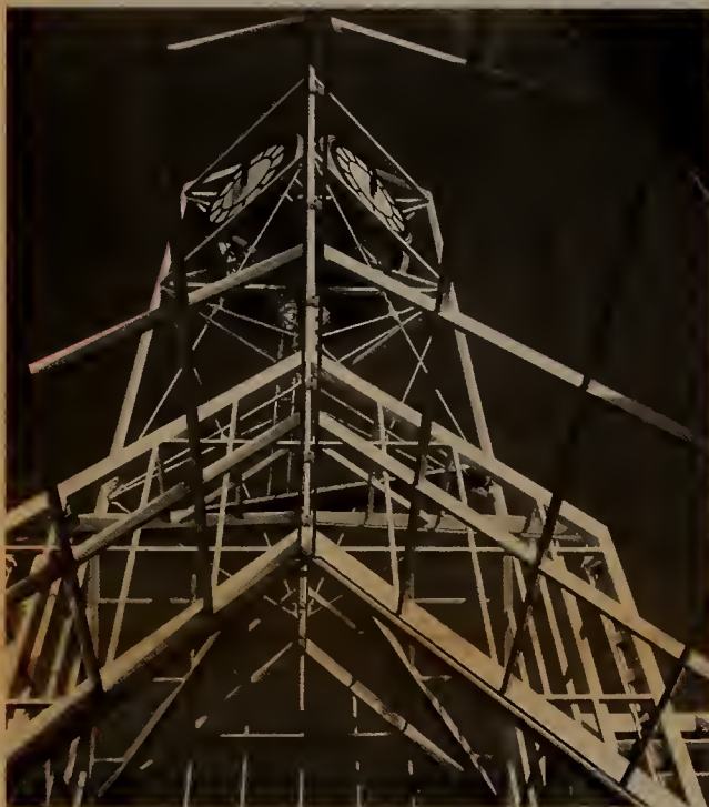
A skeletal view of the Forest Hills Clock Tower structure

terminando. Los caminos de acceso para los autobuses están terminados y el terreno de estacionamiento para aumentar el desarrollo comercial de la Parcela 35 también ha quedado terminado.